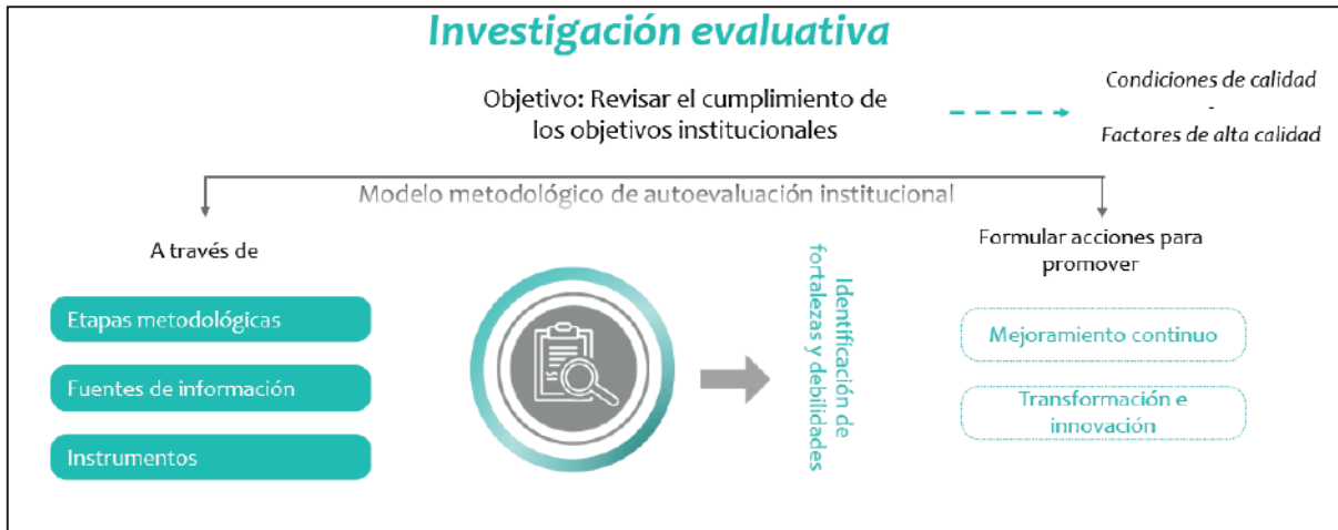
Gráfico 1. Concepto de autoevaluación de programas académicos

En este, se identifican y evalúan los discursos y las prácticas académicas, pedagógicas, investigativas, de extensión y administrativas, así como las percepciones de los estudiantes, docentes, egresados, empleadores, directivos y graduados enmarcadas en los diversos aspectos a evaluar de orden cualitativos y cuantitativos de un programa académico.