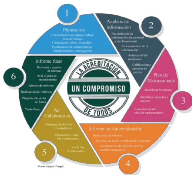
Gráfico 2. Ruta de la autoevaluación

desarrollo de un conjunto de características que definen la calidad de un programa académico de Educación Superior. El estudio identifica y evalúa los discursos, los procesos, las actividades, las prácticas pedagógicas, así como las percepciones de los estudiantes, docentes, graduados, empleados y personal administrativo de acuerdo con indicadores cualitativos y cuantitativos de un programa académico.