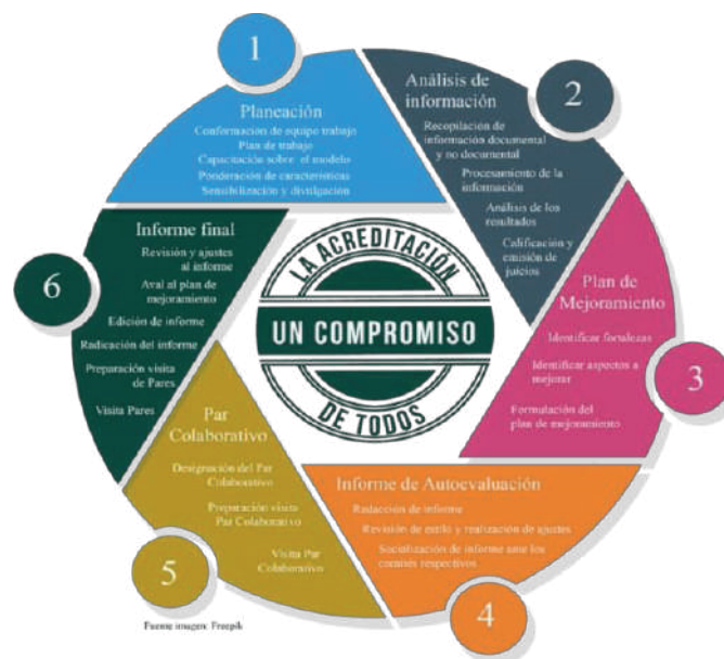
Gráfico 2. Ruta de la autoevaluación

Diseño del modelo de autoevaluación. El desarrollo del proceso de Autoevaluación de los programas Académicos en la Institución Universitaria de Envigado es una investigación evaluativa que surge de la necesidad de evaluar los programas académicos de la Institución, valorando el desarrollo de un conjunto de características que definen la calidad de un programa académico de Educación Superior. El estudio identifica y evalúa los discursos, los procesos, las actividades, las prácticas pedagógicas, así como las percepciones de los estudiantes, docentes, graduados, empleados y personal administrativo de acuerdo con indicadores cualitativos y cuantitativos de un programa académico.