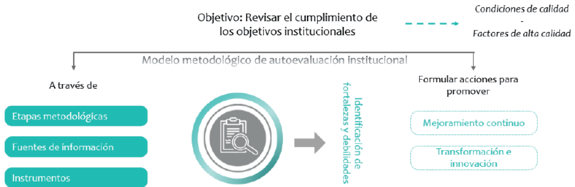
Gráfico 1. Concepto de autoevaluación de programas académicos

En este, se identifican y evalúan los discursos y las prácticas académicas, pedagógicas, investigativas, de extensión y administrativas, así como las percepciones de los estudiantes, docentes, egresados, empleadores, directivos y graduados enmarcadas en los diversos aspectos a evaluar de orden cualitativos y cuantitativos de un programa académico.